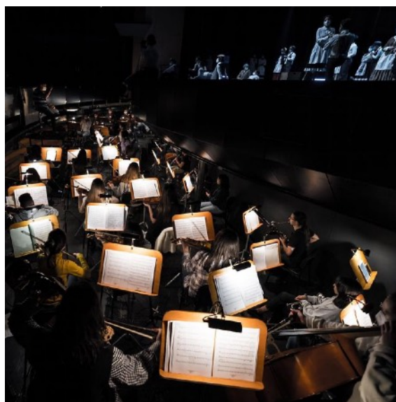
Dos momentos de la representación que tuvo lugar en el Palacio de Festivales de Santander.

La revolución industrial del siglo XIX y las transformaciones sociales y económicas que se sucedieron en el norte de la península como consecuencia de la división entre el proletariado y la burguesía han sido el marco del proyecto, un espectáculo musical inédito diseñado por Igor Giménez (dirección orquestal) y César Maraño (dirección coral y escénica).