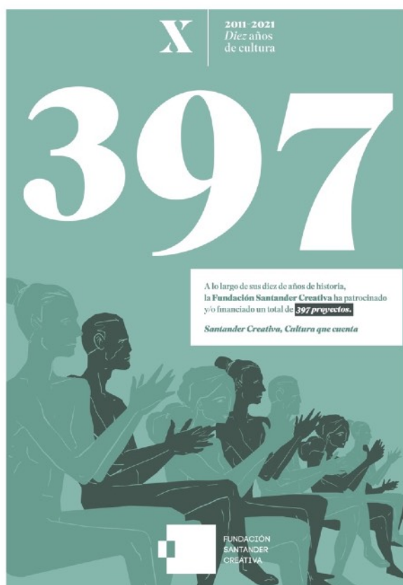
Dos de las piezas que componen la campaña ‘Cultura que cuenta’