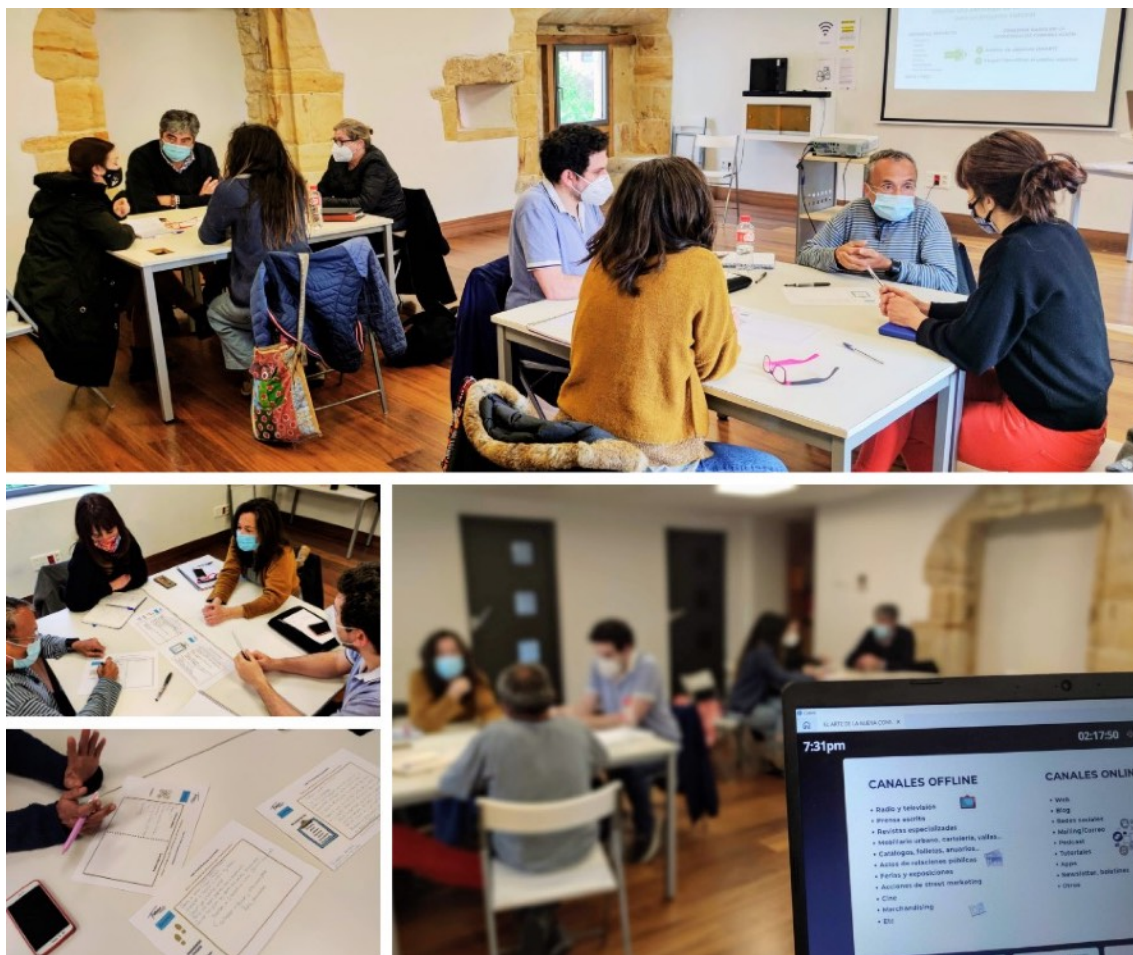
El taller de comunicación que inauguró la programación se celebró en Enclave Pronillo.

Más de 120 profesionales del sector cultural de Cantabria se han beneficiado de estas propuestas.