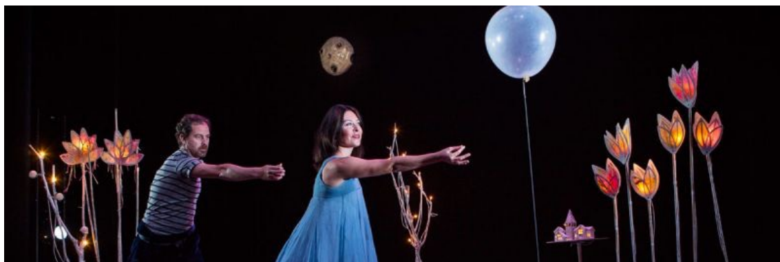
Escenografía de “Grillos y Luciérnagas”.

El trabajo es una investigación actoral a partir de sus sentidos y recuerdos, un trabajo desarrollado con ayuda de literatura para los más pequeños sobre la noche, la oscuridad y el miedo que a menudo los acompaña.