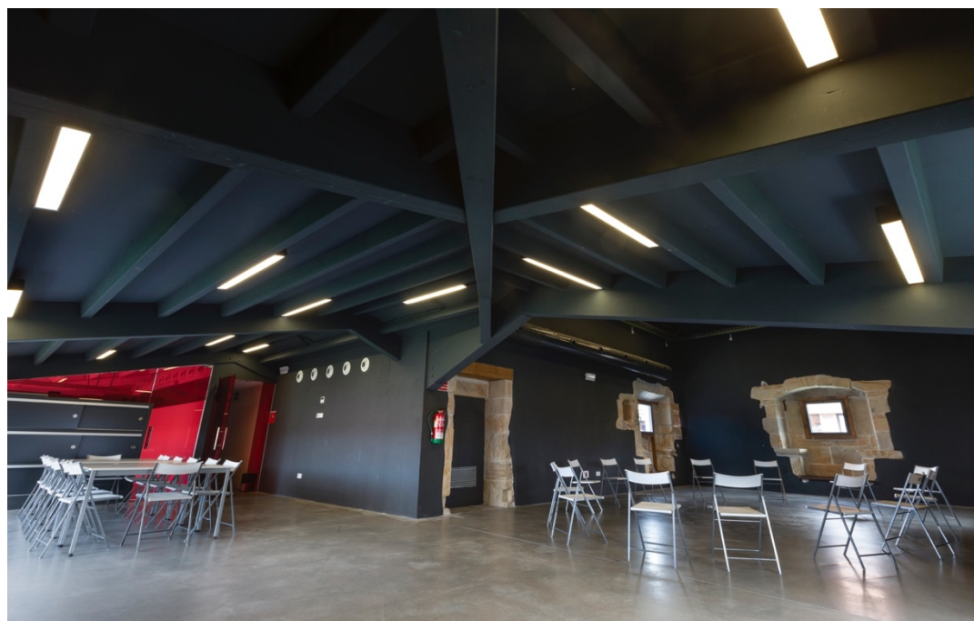
Espacio Torre

Los espacios interiores están dotados de mobiliario (mesas y sillas), proyector, pantalla, sistema de audio, reproductor DVD y conexión wifi.